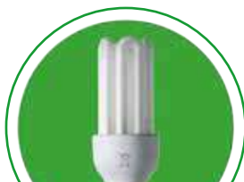
Lampe à LED