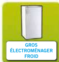
GROS ÉLECTROMÉNAGER FROID