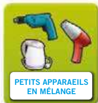
PETITS APPAREILS EN MÉLANGE

Appelés DEEE, ce sont les appareils électriques ou électroniques en fin de vie à trier selon 4 catégories. Attention : les équipements professionnels ne sont pas acceptés.