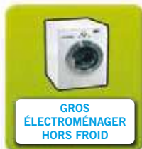
GROS ÉLECTROMÉNAGER HORS FROID